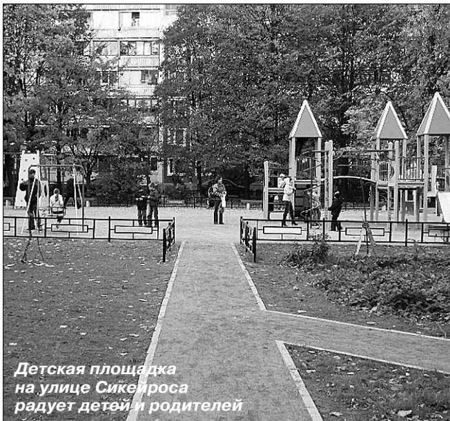
Детская площадка на улице Сикейроса радует детей и родителей

В адресную программу по благоустройству на 2011 год вошли 35 адресов.