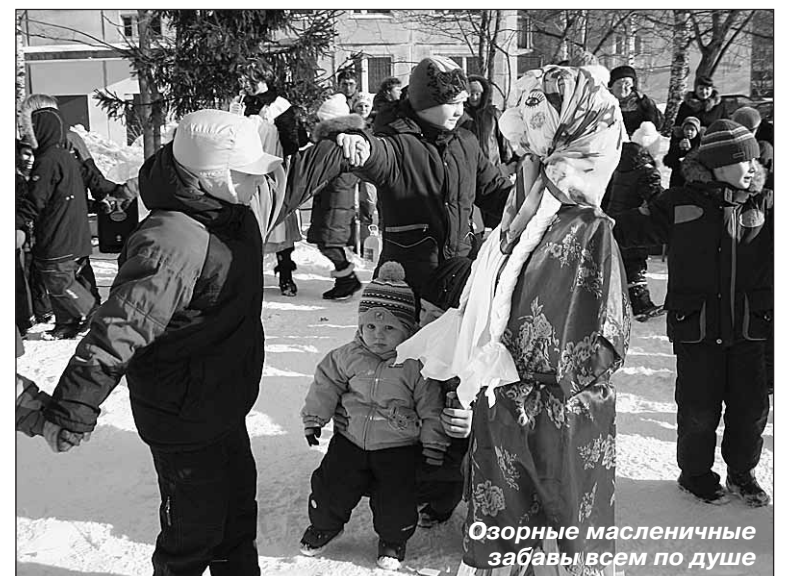
Озорные масленичные забавы всем по душе